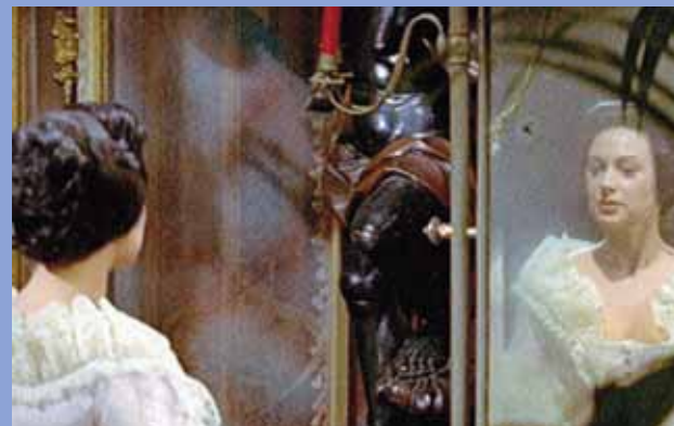
Max Ophüls Lola Montès

Nel 2008 la Cinémathèque, dopo un paziente lavoro di ricostruzione, ha restituito al pubblico l'opera nella sua interezza. La proiezione sarà preceduta da un incontro con Serge Toubiana , direttore della Cinémathèque Française, e Laurence Braunberger , figlia del produttore francese Pierre Braunberger che, nel 1966, aveva acquisito i diritti del film nella speranza di poterlo un giorno restaurare.